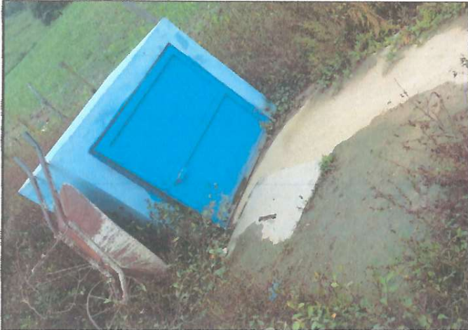
Foto1: Reparación de cisterna y depósito de agua